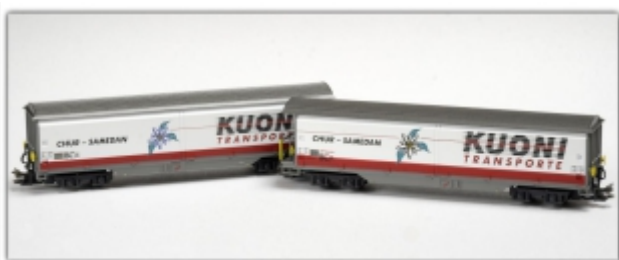
MD-61013.Nm: RhB Wagenset: Haiq-v5132 Kuoni und Haiq-v5133 Kuoni, Spur Nm, MDS-Modell

Schiebewandwagen mit Haiq-v 5128 „Möbel Pfister“ Spur N (9mm) mit N-Standardkupplung oder wahlweise Spur Nm (6,5mm) mit Kato-Kurzkupplung