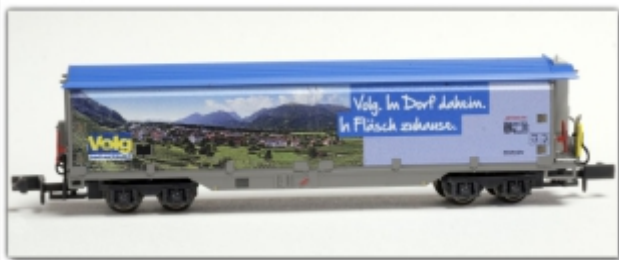
MD-61010.N: RhB Schiebewandwagen Haiqq-tuыз5174 Volg Motiv Fläsch, Spur N, MDS-Modell

Schiebewandwagen mit Haiqq-tuыз 5174 VOLG „VOLG. Im Dorf daheim.“ Motiv Fläsch Spur N (9mm) mit N-Standardkupplung oder wahlweise Spur Nm (6,5mm) mit Kato-Kurzkupplung