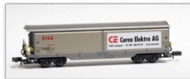
MD-61014.N: RhB Schiebewandwagen Haiqq-y5166 Curea Elektro, Spur N, MDS-Modell

Schiebewandwagenset Haiq-v 5132 und Haiq-v 5133 mit Werbung für die Spedition „Kuoni“ Spur N (9mm) mit N-Standardkupplung oder wahlweise Spur Nm (6,5mm) mit Kato-Kurzkupplung