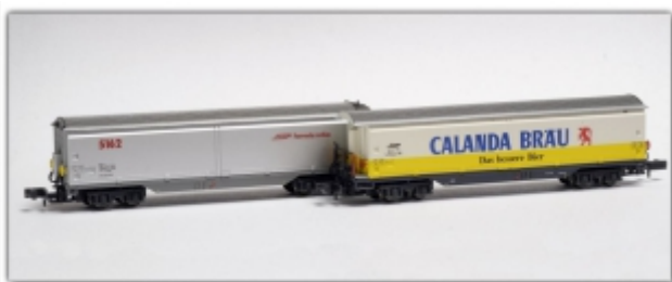
MD-61011.N: RhB Wagenset: Haiq-qv5161 Calanda und Haiqq-y5162 silber, Spur N, MDS-Modell

Neben den Güterwagen sind auch die Lokomotiven im Zulauf. Wir berichten darüber, sobald diese bei uns eingetroffen sind.