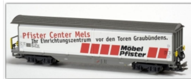
MD-61012.Nm: RhB Schiebewandwagen Haiq-v5128 Möbel Pfister, Spur Nm, MDS-Modell

Schiebewandwagenset mit Haiq-qv 5161 Calanda und Haiqq-y 5162 „RhB“, silber Spur N (9mm) mit N-Standardkupplung oder wahlweise Spur Nm (6,5mm) mit Kato-Kurzkupplung