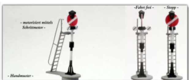
Zub-346.2: Hippsche Wendescheibe, 1 Stück, 3D-Druck, einbaufertig lackiert, motorisiert, 1:160, Klett-Modellbau

typisches Signal aus den Anfängen der Eisenbahnzeit nach Vorbild der Hippschen Wendescheibe motorisiertes Modell wahlweise für N oder Nm einsetzbar