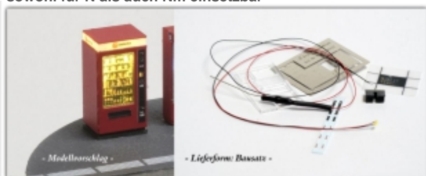
Nm-Y00321: Selecta Warenautomat, Ätz-/3D-Druck-Bausatz, 1 St., mit LED-Beleuchtung, Spuren Nm oder N

typischer Warenautomat, wie er an fast allen Bahnhöfen in der Schweiz anzutreffen ist Bausatz, inklusive LED-Beleuchtung sowohl für N als auch Nm einsetzbar