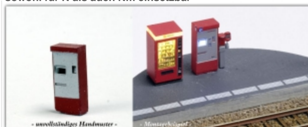
Nm-Y00322: RhB Fahrkartenautomat, fertig lackiert, beleuchtet, 3D-Druckteil, Spuren Nm oder N

Fahrkartenautomat der Rhätischen Bahn, wie er auf jedem Bahnhof der RhB anzutreffen ist detailliertes Fertigmodell mit LED-Beleuchtung sowohl für N als auch Nm einsetzbar