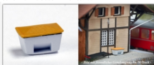
Nm-Y00312: Salz-/Streugut-Behälter, fertig lackiert, 2 Stück, 3D- Druckteile, Spuren Nm oder N

Salz-/Streugutbehälter im 3D-Druck erstellt zwei Fertigmodelle im Set sowohl für N als auch Nm einsetzbar