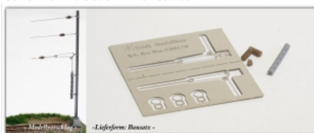
Nm-Y00170: Spannwerk, mit Gewichtsattrappe, finescale für H- Profilmasten 1,5x1,5mm, 1 St., Bausatz

Radspannwerk, inkl. Isolatoren und Gewichtsattrappe finescale-Bausatz für 1,5x1,5mm H-Profil-Masten sowohl für N als auch Nm einsetzbar