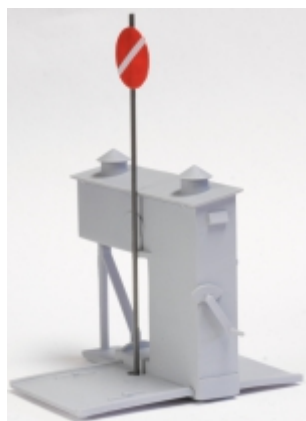
Das Spur 0-/0m-Muster stand uns für Fotoaufnahmen zur Verfügung. Mit gut 7cm Höhe ein imposantes Zubehörteil.

Falls Sie Interesse an einer motorisierten Version haben, geben Sie uns bitte einen Hinweis. Bei ausreichend Nachfrage würden wir im nächsten Jahr eine solche Variante anbieten.