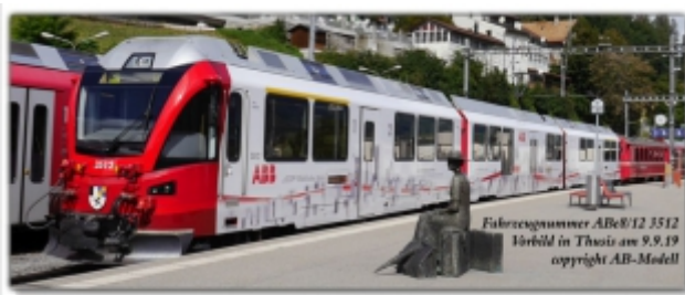
KT-007.7N: RhB ABe8/12 3510, ABB-Werbemodell „Berge“, Spur N (9mm), mit Kato-Kurzkupplung

Werbemodell des Allegra 3510 mit ABB-Motiv „Berge“ Motiv seit 1999, Let's write the future of mobility Ausführungen: Kato-Modell für Spur N oder Spur Nm Das Motiv ist NICHT identisch mit unserem Modell!