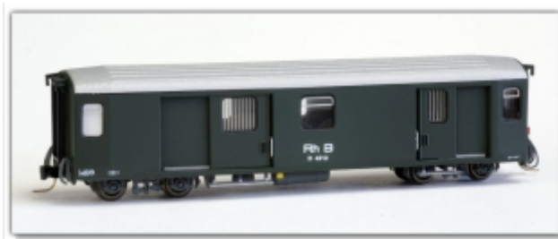
Nm-112.5: RhB vierachsiger Gepäckwagen D4210 - 4213, grün mit weißem RhB-Signet (1970er), Spur Nm (6,5mm)

vierachsiger Gepäckwagen, grün mit weißen Anschriften und ursprünglichem RhB-Signet, Ausführung 1970er Jahre ausschließlich für Nm (6,5mm Spurweite) erhältlich Neusilber-Handarbeitsmodell made in Germany