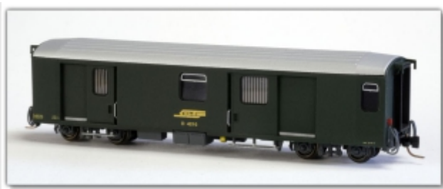
Nm-112.4: RhB vierachsiger Gepäckwagen D4210 - 4213, grün mit gelben Anschriften (1980er), Spur Nm (6,5mm)

vierachsiger Gepäckwagen, grün mit gelben Anschriften und modernem RhB-Logo, Ausführung ca. 1980er Jahre ausschließlich für Nm (6,5mm Spurweite) erhältlich Neusilber-Handarbeitsmodell made in Germany