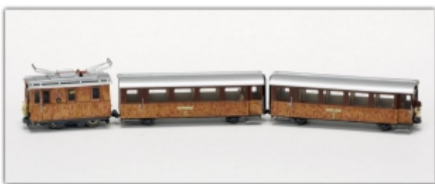
Nm-534.3: Eiger-Ambassador-Express mit He2/2 #11, B17 und B13, motorisiert (3V Busch-Feldbahnantrieb)

Eiger-Ambassador-Express bestehend aus Lokomotive He2/2 11, sowie den beiden Vorstellwagen B17 und B13 Neusilber-Handarbeitsmodelle made in Germany Motorisierung mittels Busch-H0f-Feldbahnantrieb 3V Lok und Vorstellwagen sind auch einzeln erhältlich