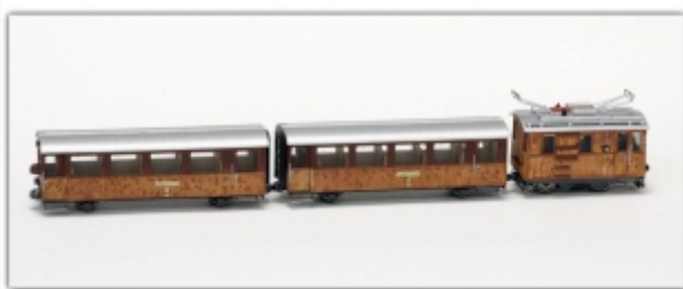
Nm-534.4: Jungfraubahn-Set mit He2/2 #11, B17 und B13, motorisiert (3V Busch-Feldbahnantrieb)

Jungfraubahn-Zugset bestehend aus Lokomotive He2/2 11, sowie den beiden Vorstellwagen B17 und B13 Neusilber-Handarbeitsmodelle made in Germany Motorisierung mittels Busch-H0f-Feldbahnantrieb 3V Lok und Vorstellwagen sind auch einzeln erhältlich