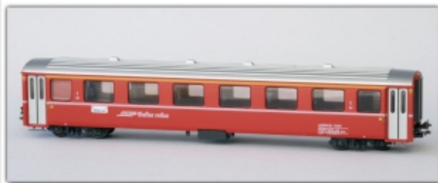
PI-9201.N: RhB A(WR-S)223 Restaurant, Spur N (9 mm), mit Kato-Kurzkuppl., Pirata-Modell, Basis Kato EW I

Behelfsspeisewagen auf Basis des EW I Umlackierung durch Pirata basiert auf dem Kato EW I Spur N (9mm) mit Kato-Kurzkupplung in attraktiver Klappschachtel