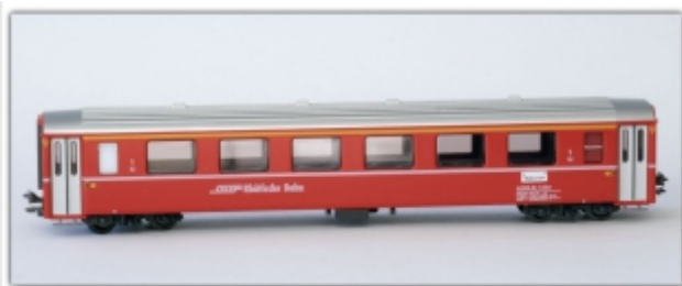
PI-9201.Nm: RhB A(WR-S)223 Restaurant, Nm (6,5mm), mit Kato-Kurzkuppl., Pirata-Modell, Basis Kato EW I

Behelfsspeisewagen auf Basis des EW I Umlackierung durch Pirata basiert auf dem Kato EW I von uns umgespurt auf Spur Nm (6,5mm) mit Kato-Kurzkupplung in attraktiver Klappschachtel