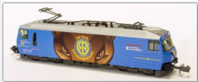
KT-056.2N: RhB Ge4/4 III 652 HCD Hockey Club Davos, Spur N (9mm), limitiertes Kato-Modell, N-Kuppl.

Art.-Nr./item-no./produit-no. blaue Werbelok des Hockey Club Davos (HCD) limitiertes Sondermodell von Kato, standardmäßig als Spur N-Modell erhältlich, wir bieten es auch als umgespurtes Schmalspurfahrzeug an