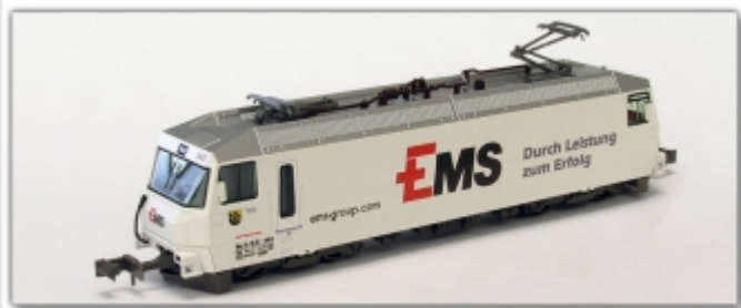
KT-059.1N: RhB Ge4/4 III 643 EMS-Chemie, Spur N (9mm), limitiertes Kato-Modell, mit N-Standard-Kupplung

Art.-Nr./item-no./produit-no. weiße Werbelok der EMS-Chemie limitiertes Sondermodell von Kato, standardmäßig als Spur N-Modell erhältlich, wir bieten es auch als umgespurtes Schmalspurfahrzeug an