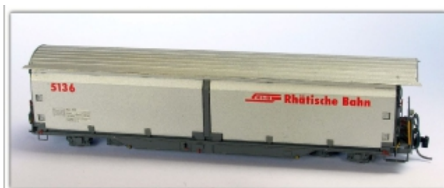
Nm-001.1: RhB Schiebewandwagen Hai-v 5136 - 5139

modified opening mechanism on handwheels available from: November 2019