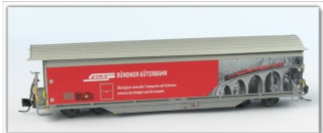
Nm-001.2: RhB Hai-tvz 5139, Werbemodell Bündner Güterbahn, Neusilber-Handarbeitsmodell für Nm (6,5mm)