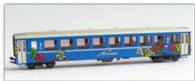
PI-9210.N: RhB B2319 Arosa-Express, Spur N (9 mm), mit Kato-Kurzkuppl., Pirata-Modell, Basis Kato EW I