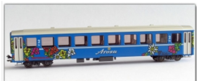
PI-9210.Nm: RhB B2319 Arosa-Express, Spur Nm (6,5mm), mit Kato-Kurzkuppl., Pirata-Modell, Basis Kato EW I

umdekoriertes Einheitswagen I in RhB-Arosa Express B2319 Hersteller Pirata auf Basis eines Kato-2.Klasse-Modells Spur N (9mm) mit Kato-Kurzkupplung