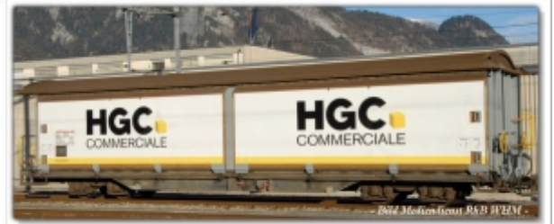
MD-61003.N: RhB Schiebewandwagen Haik-v 5134 HG Commerciale, Spur N (9mm), MDS-Modell