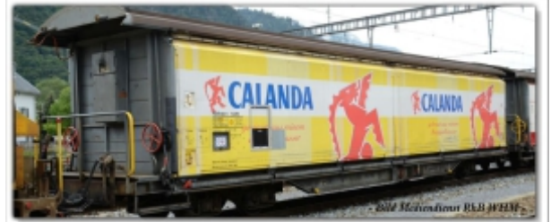
MD-61004.N: RhB Schiebewandwagen Haik-v5170 Calanda Bräu, Spur N (9mm), MDS-Modell