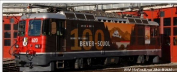
MD-60004.N: RhB Ge4/4 II 620, 100 Jahre Engadin, Spur N (9 mm), mit Rapidokupplung, MDS-Modell