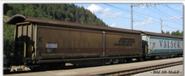
MD-61000.N: RhB Schiebewandwagenset 1: Haik-v5126 VALSER, Haik-v5129 RhB, Spur N, MDS-Modell

Im Doppelpack kommen die VALSER- und RhB-Wagen mit rotem Streifen, die in langen Zügen im Rheintal täglich zu beobachten sind.