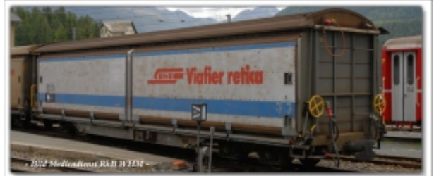
MD-61002.N: RhB Schiebewandwagen Haik-v5169 RhB mit blauen Streifen, Spur N (9mm), MDS-Modell