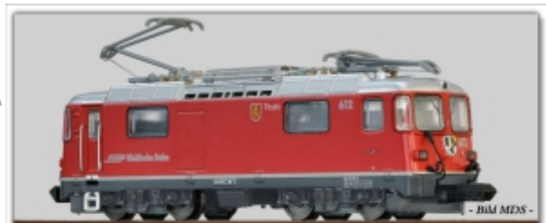
MD-60001.N: RhB Ge4/4 II 612 rot, Wappen Thuisis, Spur N (9 mm), mit Rapidokupplung, MDS-Modell