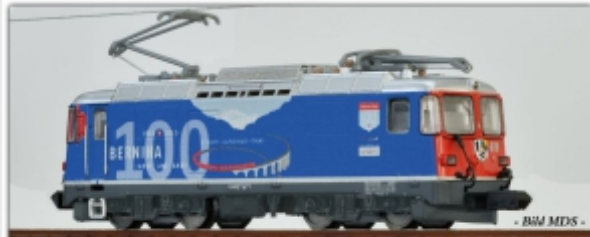
MD-60002.N: RhB Ge4/4 II 619, 100 Jahre Bernina, Spur N (9 mm), mit Rapidokupplung, MDS-Modell

vorbildliche Bedruckung: 2 rote und 3 Werbevarianten Antrieb mit wartungsfreiem Glockenankermotor Antrieb auf alle Achsen, mit 2 Haftreifen (diagonal liegend) gekapseltes Getriebe (kein Eindringen von Staub/Schotter) Kupplungsaufnahme für handelsübliche Kupplungen fahrtrichtungsabhängiger Lichtwechsel weiß/rot Ausrüstung analog, auf Wunsch mit eingebautem DCC-Decoder bzw. DCC-Sounddecoder Onboard für Lautsprechereinbau vorbereitet Handläufe aus Metall sind extra angesetzt Elektroleitungen und Bremsschläuche sind extra angesetzt Umlaufbleche an den Stirnseiten als Ätzteile ausgeführt Dachschutzzitter als Ätzteil ausgeführt Dachleitungen größtenteils aus Metall bewegliche Stromabnehmer (funktionslos) Mindestradius 150mm