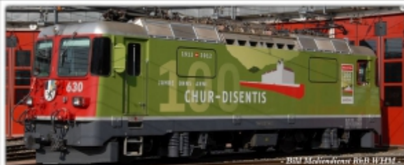
MD-60003.N: RhB Ge4/4 II 630, 100 Jahre Rheintal, Spur N (9 mm), mit Rapidokupplung, MDS-Modell