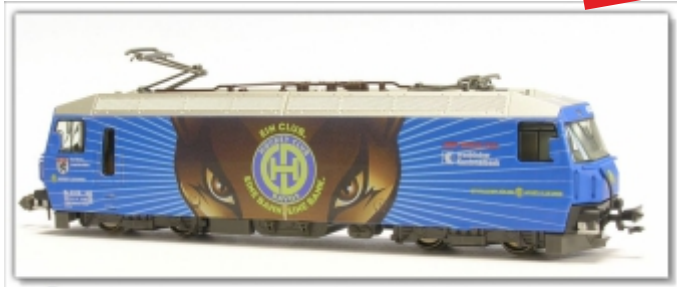
KT-056.1Nm: RhB Ge4/4''' 652 HCD Hockey Club Davos, Spur Nm (6,5mm), mit Kato-Kurzkupplung

Der Hockey-Club Davos (HCD) ist Schweizer Rekordmeister im Eishockey und wirbt seit 2006 mit einer eigenen Werbelokomotive auf dem Netz der Rhätischen Bahn. Dazu wurde der Wagenkasten komplett blau lackiert, die Seitenwände mit einem plakativen Kopfmotiv beklebt und auf den Stirnwänden das Steinbock-Logo des HCD angebracht. Unter dem Werbeslogan: „Ein Club, Eine Bahn, Eine Bank“ werden die Hauptsponsoren RhB und Graubündner Kantonalbank gleich mit beworben.