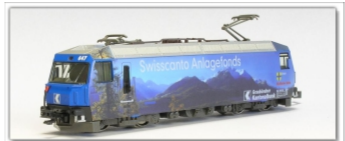
KT-057.1Nm: RhB Ge4/4''' 647 Graubündner Kantonalbank, Spur Nm (6,5mm), mit Kato-Kurzkupplung

Schon 1998 nutzte die Graubündner Kantonalbank die großen Seitenflächen der Schnellzuglokomotive als Werbeträger für ihren Marktauftritt. Ab 2005 erschien dann das aufwändige Landschaftsmotiv, das sich sogar bis auf das Dach fortsetzt und für die Investmentfonds der Swisscanto-Serie wirbt. Auf der Stirnseite ist das schlichte K-Logo der Bank angebracht.