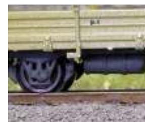
detaillierte Darstellung der Bremsanlage