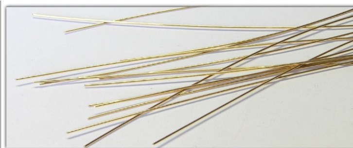
0-803.12: Fahrdrahthalter für 0m-850.x, Bronze, 0,5 mm, federhart, 12 Stück, Länge ca. 10 cm, Bausatz