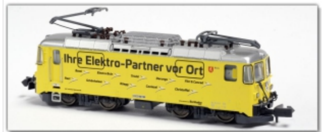
MD-60014.N: RhB Ge4/4" 612 gelb, Werbemod. Burkhalter-Gruppe, Spur N (9 mm), N-Kupplung, MDS-Modell

Universallokomotive der Rhätischen Bahn Ge4/4" 618 Werbemotiv „flyedelweiss.com“ Spur N (9mm) mit N-Standardkupplung