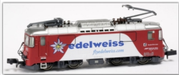
MD-60013.N: RhB Ge4/4" 618 rot, Werbemodell „fly edelweiss“, Spur N (9 mm), mit Rapidokupplung, MDS-Modell

Die nebenstehende Werbelokomotive wirbt für die Spendenaktion zur Wiederinbetriebnahme der ersten Dampflok der Rhätischen Bahn G3/4 Nr. 1 „Rhätia“. Von jedem verkauften Modell fließen EUR 5,- in die Spendenkasse der historic RhB, die direkt für den Erhalt und die erneute Inbetriebnahme der historisch wertvollen Schätze verwendet werden.