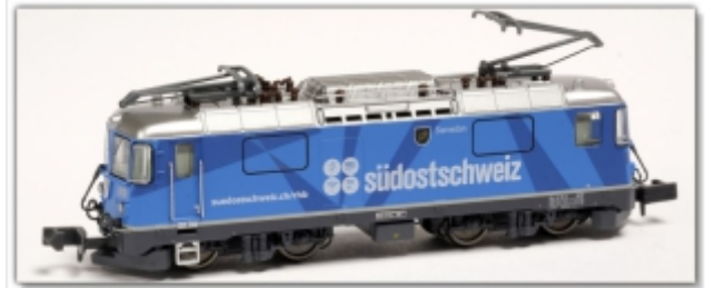
MD-60015.N: RhB Ge4/4" 619 blau, Werbemod. Südostschweiz, Spur N (9 mm), N-Kupplung, MDS-Modell

Alle Modelle werden in drei Ausstattungsvarianten angeboten. Standardmäßig sind die Loks analog erhältlich. Ab Werk sind auch digitalisierte Modelle, sowie Digitalloks mit Sound verfügbar. Digitalfahrer bestellen bitte bei uns direkt eine digitalisierte oder eine Soundlokomotive, da wir in unserer Werkstatt keine Digitalum- und -einbauten vornehmen.