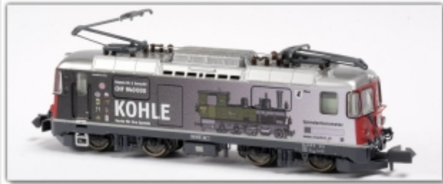
MD-60005.N: RhB Ge4/4" 616, Spendenlok „Rhätia“, Spur N (9 mm), mit Rapidokupplung, MDS-Modell

Universallokomotive der Rhätischen Bahn Ge4/4" 616 Werbemotiv „Rhätia“ Spur N (9mm) mit N-Standardkupplung