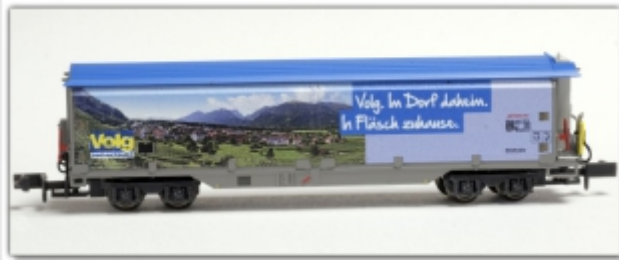
MD-61010.N: RhB Schiebewandwagen Haiqq-tuыз5174 Volg Motiv Fläsch, Spur N, MDS-Modell

Schiebewandwagen mit Haiqq-tuыз 5174 VOLG „VOLG. Im Dorf daheim.“ Motiv Fläsch Spur N (9mm) mit N-Standardkupplung oder wahlweise Spur Nm (6,5mm) mit Kato-Kurzkupplung