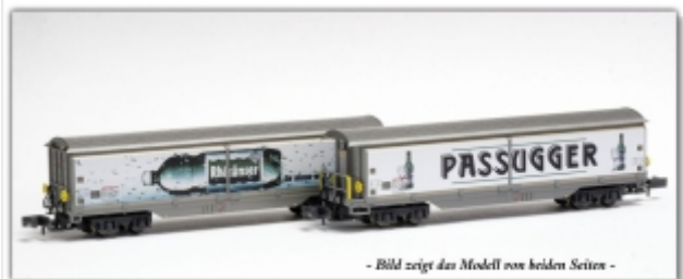
MD-61015.N: RhB Schiebewandwagen Haik-qy5168 Rhäzünser/Passugger, Spur N, MDS-Modell

Schiebewandwagen Haik-qy 5168 mit Werbung für Rhäzünser/Passugger (ein Wagen, zwei unterschiedliche Seitenwerbungen) Spur N (9mm) mit N-Standardkupplung oder wahlweise Spur Nm (6,5mm) mit Kato-Kurzkupplung