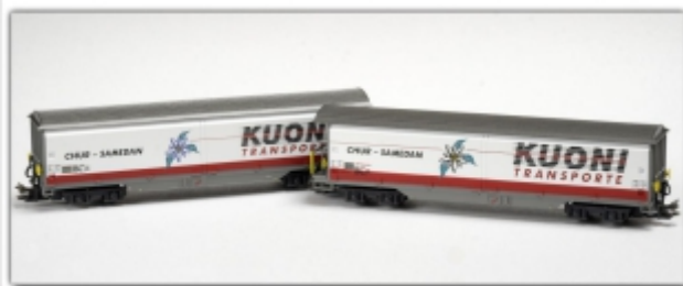
MD-61013.Nm: RhB Wagenset: Haiq-v5132 Kuoni und Haiq-v5133 Kuoni, Spur Nm, MDS-Modell

Schiebewandwagen mit Haiq-v 5128 „Möbel Pfister“ Spur N (9mm) mit N-Standardkupplung oder wahlweise Spur Nm (6,5mm) mit Kato-Kurzkupplung