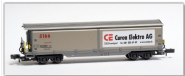
MD-61014.N: RhB Schiebewandwagen Haiqq-y5166 Curea Elektro, Spur N, MDS-Modell

Schiebewandwagenset Haiq-v 5132 und Haiq-v 5133 mit Werbung für die Spedition „Kuoni“ Spur N (9mm) mit N-Standardkupplung oder wahlweise Spur Nm (6,5mm) mit Kato-Kurzkupplung