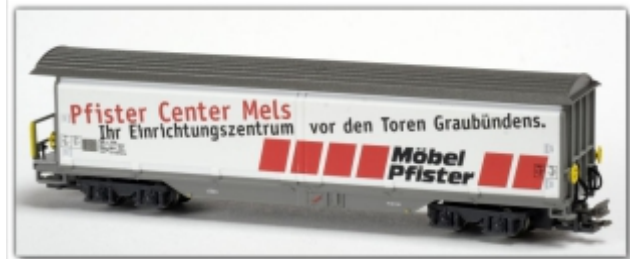
MD-61012.Nm: RhB Schiebewandwagen Haiq-v5128 Möbel Pfister, Spur Nm, MDS-Modell

Schiebewandwagenset mit Haiq-qv 5161 Calanda und Haiqq-y 5162 „RhB“, silber Spur N (9mm) mit N-Standardkupplung oder wahlweise Spur Nm (6,5mm) mit Kato-Kurzkupplung