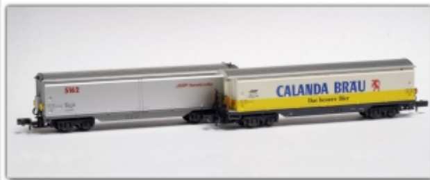
MD-61011.N: RhB Wagenset: Haiq-qv5161 Calanda und Haiqq-y5162 silber, Spur N, MDS-Modell

Neben den Güterwagen sind auch die Lokomotiven im Zulauf. Wir berichten darüber, sobald diese bei uns eingetroffen sind.