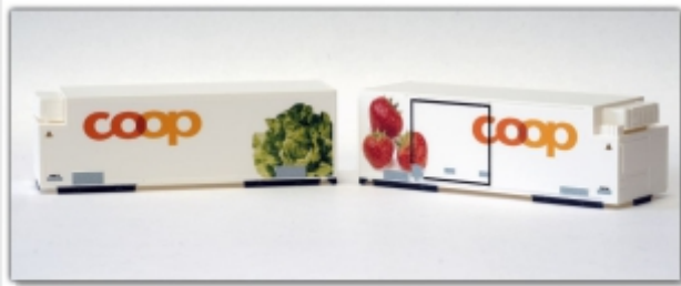
KT-014.2: Kühlwechselbehälterset Coop Erdbeere und Salat, Kato-Modelle, Maßstab 1:150, für N und Nm