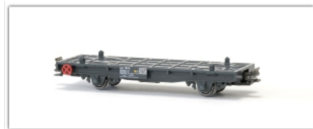
KT-014.1N: RhB Lb-v 7874, unbeladen, Spur N (9mm), Kato-Modell, mit Kato-Kurzkupplung

Sie lassen sich nicht auf die Kato-Modelle aufklipsen! Die Haltezapfen werden abgetrennt und die herstellerfremden Container aufgeklebt. Mit Rubber-Cement oder dem Hin-und-Weg-Kleber von NOCH lässt sich die Beladung wieder entfernen und gegen eine andere ersetzen.