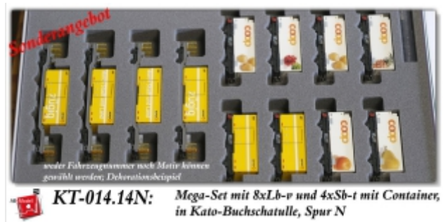
KT-014.14N: Mega-Set mit 8xLb-v und 4xSb-t mit Container, in Kato-Buchschatulle, Spur N

Spur N - EUR 275,--* Spur Nm - EUR 475,--* Ersparnis - EUR 61,-- ggü. Einzelkauf