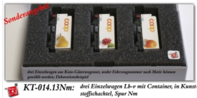
KT-014.13Nm: drei Einzelwagen Lb-v mit Container, in Kunststoffschachtel, Spur Nm

Set aus einem zwei- und einem vierachsigen Tragwagen, inkl. Container, aus dem Güterzugset KT-014.1, in unserer Schachtel sicher verpackt, für Sammler und Wagenfans