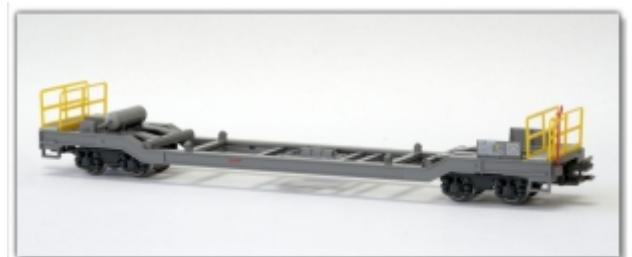
KT-015.1N: RhB Sb-t 65658, unbeladen, Spur N (9mm), Kato-Modell, mit Kato-Kurzkupplung