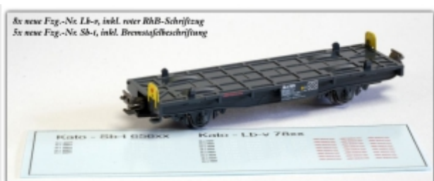
KT-014.0D: Decalset für Kato-Güterwagenset, neue Fahrzeugnummern und Beschriftungen für Sb-t und Lb-v