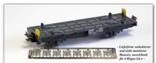
KT-014.1A: Ätzteilset für Kato-Güterwagen Lb-v zur Darstellung der gelben Tafel an beiden Wagenenden, für 4 Wagen