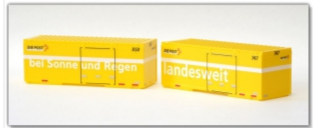
KT-014.3: Wechselbehälterset Post „747 landesweit“, „850 bei Sonne und Regen“, Kato-Modelle, Maßstab 1:150, für N / Nm

Sie brauchen mehr Container-Auswahl? Wir haben noch sehr kleine Restbestände in Coop- und Post-Wechselbehältern, Hersteller Kato, passend zu den Tragwagen