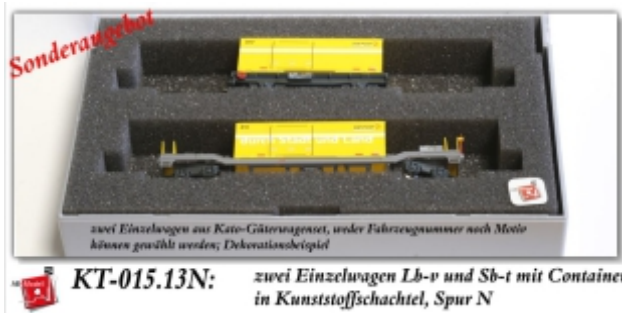
KT-015.13N: zwei Einzelwagen Lb-v und Sb-t mit Container, in Kunststoffschachtel, Spur N