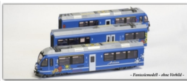
KT-007.8N: RhB ABe8/12 3500, Arosa-Werbemodell, Spur N (9mm), mit Kato-Kurzkupplung

Werbemodell des Allegra 3500 mit Arosa-Motiv Fantasiemodell, blau, mit Arosa-Anschrift und -Decor Ausführungen: Kato-Modell für Spur N oder Spur Nm Umspürungen führt Meterspur-Schweiz für uns aus