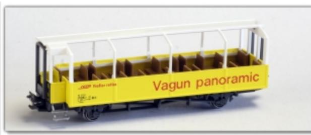
KT-012.2N: RhB - zweiachsiger, offener Aussichtswagen, B 2 2101, Kato-Modell für Spur N

offener Aussichtswagen der Rhätischen Bahn, zum Einsatz als Rail-Rider im Albula- oder Rheintal, und über den Bernina-Pass NEUE Betriebsnummer: B 2 2101 Umspürungen führt Meterspur-Schweiz für uns aus