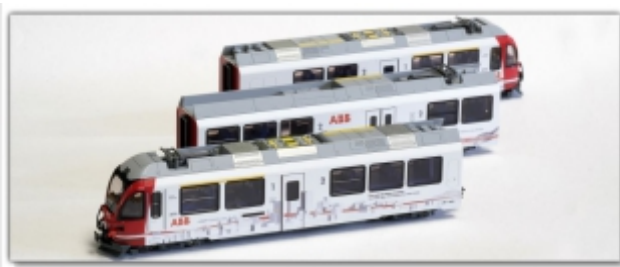
KT-007.7N: RhB ABe8/12 3510, ABB-Werbemodell „Berge“, Spur N (9mm), mit Kato-Kurzkupplung

Werbemodell des Allegra 3510 mit ABB-Motiv „Berge“ Motiv seit 1999, Let's write the future of mobility Ausführungen: Kato-Modell für Spur N oder Spur Nm Umspürungen führt Meterspur-Schweiz für uns aus