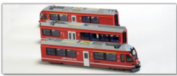
KT-007.6N: RhB ABe8/12 3506 „Anna von Planta“, Kato-Modell für Spur N (9mm)

Zweispannungstriebzug, 3-teilig, für Bernina-Bahn und Stammnetzeinsätze, meist mit dem Bernina Express NEUE Betriebsnummer: 3506 „Anna von Planta“ Umspürungen führt Meterspur-Schweiz für uns aus