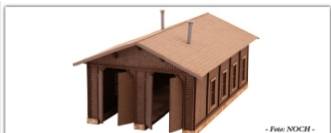
Zub-353.2: Lokschuppen Bergün, Lasercut-Bausatz, Herst. NOCH, Grundriss: 139x84mm (H=66mm)

Umfangreicher Lasercut-Bausatz der Firma NOCH des Lokschuppens im Graubündner Bahnhof Bergün wahlweise für N oder Nm einsetzbar