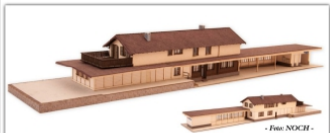
Zub-353.1: Bahnhof Bergün, Lasercut-Bausatz, Herst. NOCH, Grundriss: 337x70mm (H=50mm)

Umfangreicher Lasercut-Bausatz der Firma NOCH des Graubündner Bahnhofs Bergün, in seiner Ausführung vor dem großen Umbau im Jahre 2010 wahlweise für N oder Nm einsetzbar