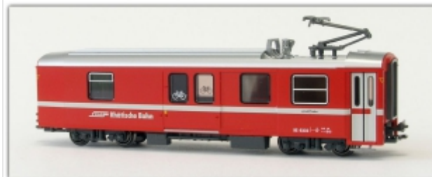
KT-013.1N: RhB - vierachsiger Gepäckwagen mit großem Tor, DS 4223, Kato-Modell für Spur N

Gepäckwagen mit großem Mitteltor je Wagenseite moderne Ausführung mit Pantograf (Heizwagen) Kato-Modell für Spur N (9mm), Maßstab 1:150 ausgerüstet mit Kurzkupplung, Standardkupplung liegt bei