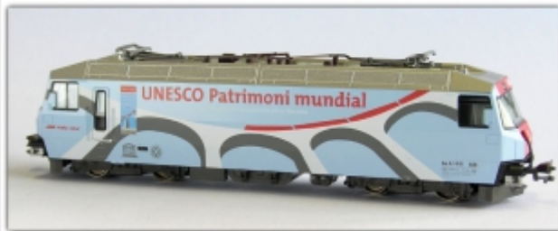
KT-005.31N: RhB Ge4/4 III 650 UNESCO-Welterbe, Sonderserie Kato, Einzellok, Spur N, Standardkupplung

Einzellokomotive, unverändert gegenüber dem ersten Set hellblaue Werbelok für das UNESCO-Welterbe Albula-Bernina Kato-Modell für Spur N (9mm), Maßstab 1:150 ausgerüstet mit Kurzkupplung, die Standardkupplung liegt bei