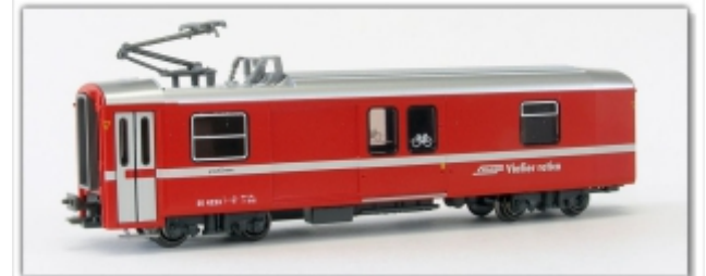
KT-013.1Nm: RhB - vierachsiger Gepäckwagen mit großem Tor, DS 4223, Kato-Modell umgespurt auf Nm 6,5mm

Gepäckwagen mit großem Mitteltor je Wagenseite moderne Ausführung mit Pantograf (Heizwagen) Kato-Modell umgerüstet auf Spur Nm (6,5mm), Maßstab 1:150 ausgerüstet mit Kurzkupplung