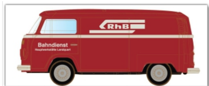
LC3919.N: VW T2 (Bulli), rot, RhB-Bahndienst Landquart, Lemke-Modell für die Spuren N und Nm

spurweitenunabhängig als Ausstattungsdetail einzusetzen Das Modell kann bei uns bereits vorbestellt werden.