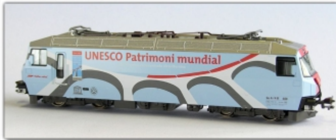
KT-005.31N: RhB Ge4/4 III 650 UNESCO-Welterbe, Sonderserie Kato, Einzellok, Spur N, Standardkupplung

Einzellokomotive, wie ursprünglich mal im Set erhältlich hellblaue Werbelok für das UNESCO-Welterbe Albula-Bernina standardmäßig als Spur N-Modell erhältlich, wir bieten es auch als umgespurtes Schmalspurfahrzeug an