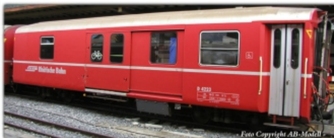
KT-013.1N: RhB - vierachsiger Gepäckwagen mit großem Tor, DS 4223, Kato-Modell für Spur N