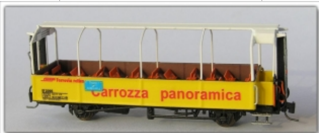
Nm-107.1: RhB - zweiachsiger, offener Aussichtswagen, B 2 2096 ff.

Spur Nm = 6,5 mm MTL-Kupplung Metallfahrwerk Neusilbermodell brünierte Metallradsätze, spitzengelagert leicht rollend Bremsbacken in Radebene folgende Fahrzeugnummern sind verfügbar: B 2 2096, 2097, 2099, 2102 wahlweise mit/ohne Routentafel (vier Ziele verfügbar: Tirano, Poschiavo, St. Moritz, Reserviert) empfohlener Mindestradius 195 mm Gewicht: ca. 11,0 g lieferbar ab: Q.III/2015