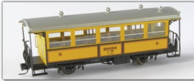
Nm-104.1: RhB historischer Zweiachser der Berninabahn C114