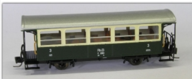
Nm-104.3: RhB Zweiachser der ehemaligen Berninabahn C 2081 ff.