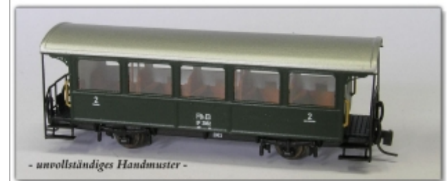
Nm-104.4: RhB Zweiachser der ehemaligen Berninabahn B 2 2081 ff.