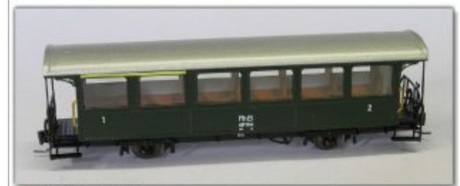
Nm-106.3: RhB Zweiachser der ehemaligen Berninabahn AB 2 1411 ff.