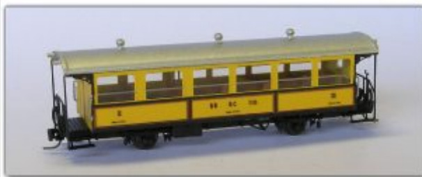
Nm-106.1: RhB historischer Zweiachser der Berninabahn BC110 - aktueller Zustand, Club 1889