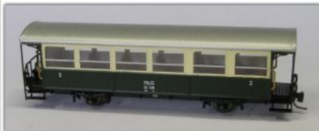
Nm-106.2: RhB Zweiachser der ehemaligen Berninabahn BC 1411 ff.