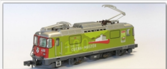
MD-60003.N: RhB Ge4/4" 630, 100 Jahre Rheintal, Spur N (9 mm), mit Rapidokupplung, MDS-Modell

Kato-Kurzkupplungen führen wir als Zubehör im Programm, auf Wunsch auch eingebaut.