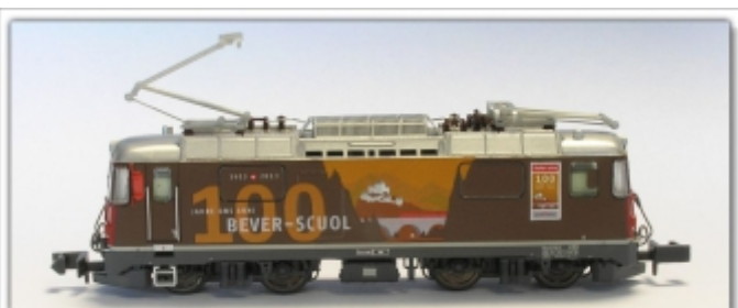
MD-60004.N: RhB Ge4/4" 620, 100 Jahre Engadin, Spur N (9 mm), mit Rapidokupplung, MDS-Modell

Ge4/4II 630 - Trun grün mit roten Fronten, vorbildliche Bedruckung zum 100. Geburtstag der Rheintal-Linie Chur - Disentis