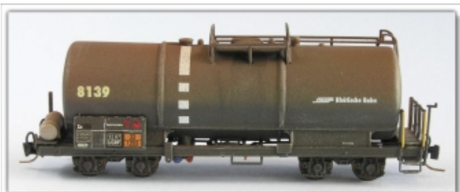
Nm-018.2: RhB Kesselwagen Za 8131 - 8140 Farbgebung grau/rotbraun (mittlere Alterung)