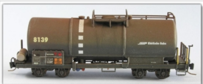
Nm-018.2: RhB Kesselwagen Za 8131 - 8140 Farbgebung grau/rotbraun (mittlere Alterung)