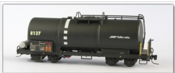
Nm-018.4: RhB Kesselwagen Za 8131 - 8140 Farbgebung anthrazit (fabrikneu)

Lackierung anthrazit Zustand nach Neulackierung