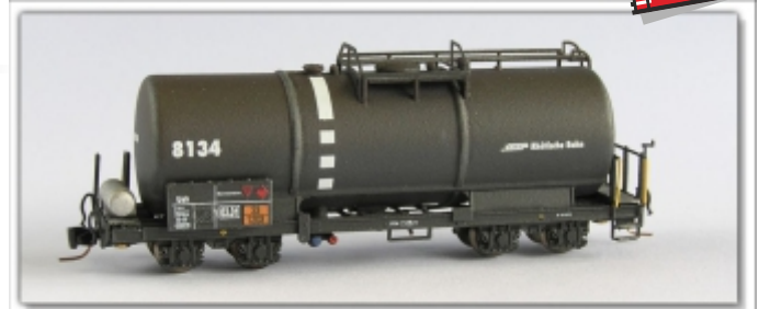
Nm-018.1: RhB Kesselwagen Uah 8131 - 8140 Farbgebung dunkelgrau (leichte Alterung)

dunkelgraue Lackierung mit leichter Alterung