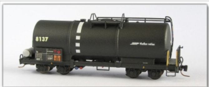
Nm-018.4: RhB Kesselwagen Za 8131 - 8140 Farbgebung anthrazit (fabrikneu)

Lackierung anthrazit Zustand nach Neulackierung