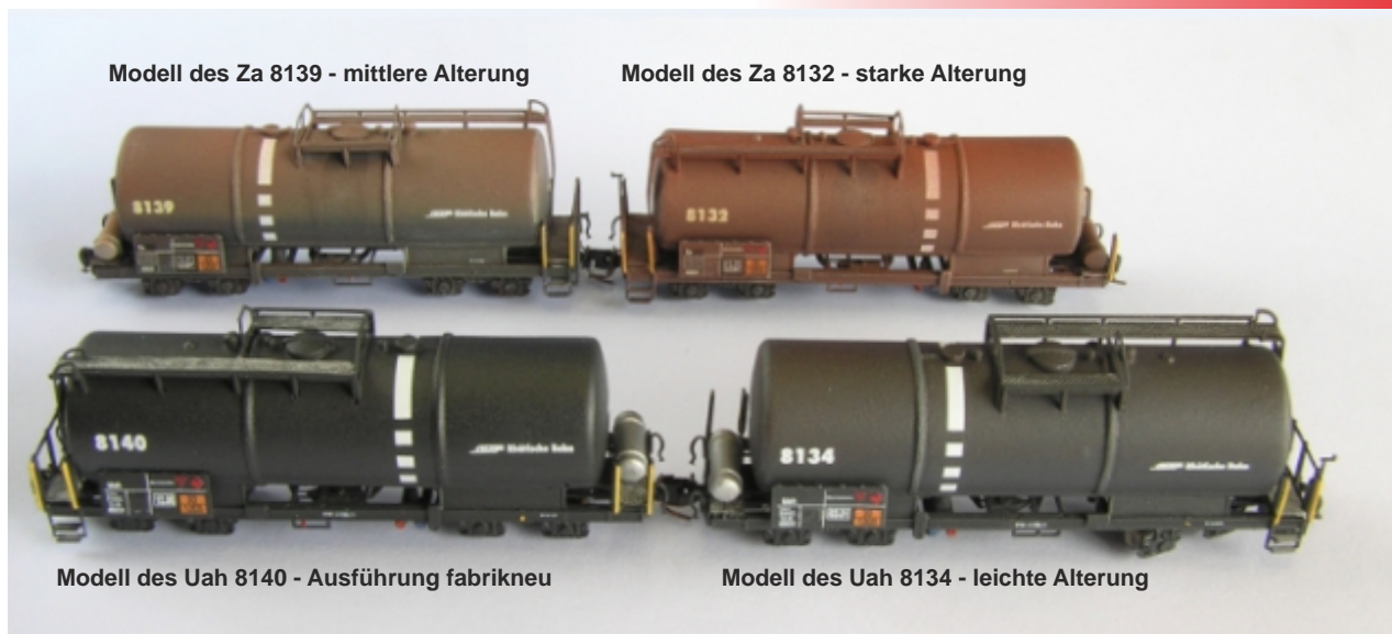
Modell des Za 8139 - mittlere Alterung

Trotz geänderter Artikelnummer behalten die Aufträge ihre Gültigkeit. Alle Kunden erhalten in Kürze eine aktualisierte Auftragsbestätigung. Ohne besondere Weisung erhalten Sie jeweils ein fabrikneues Exemplar Uah oder Za, je nach Ihrem Auftrag. Bis zum 30.09.2017 bieten wir die Modelle mit einem Vorbestellrabatt von EUR 10,-* je Fahrzeug an. Bis zum 31.12.2017 gibt es darüber hinaus noch einen Mengenrabatt: ab dem dritten Modell gibt es je Fahrzeug 1% Rabatt, maximal 5%**.