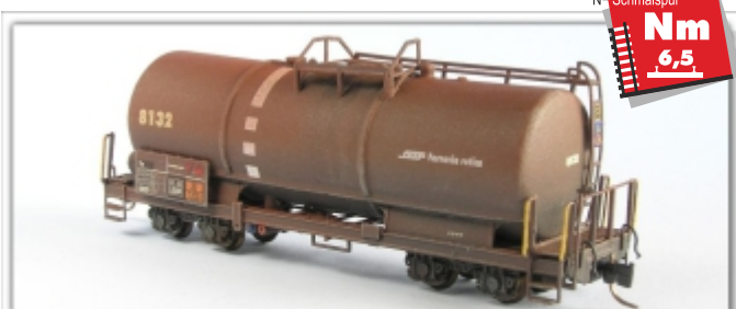
Nm-018.3: RhB Kesselwagen Za 8131 - 8140 Farbgebung grau/rostig (starke Alterung)

* Nur gültig innerhalb der Vorbestellfrist. ** Mengenrabatt wird nur auf Modelle dieser Serie gewährt, ab dem 3. Modell, maximal 5%, je Fahrzeug mit 1%-Punkt bewertet. Nur gültig für Bestellungen bis 31.12.2017. (Beispiel: 2 Tankwagen bestellt = 0% Rabatt Beispiel: 4 Tankwagen bestellt = 4% Rabatt Beispiel: 8 Tankwagen bestellt = 5% Rabatt, Maximalregelung)