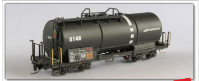
Nm-018.0: RhB Kesselwagen Uah 8131 - 8140 Farbgebung anthrazit (fabrikneu)

Lackierung anthrazit gemäß Zustand nach Aufbau des neuen Kessels