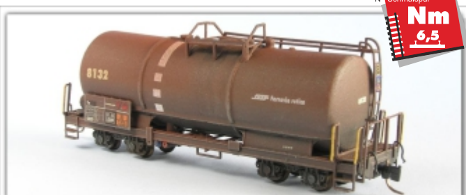
Nm-018.3: RhB Kesselwagen Za 8131 - 8140 Farbgebung grau/rostig (starke Alterung)

* Nur gültig innerhalb der Vorbestellfrist. ** Mengenrabatt wird nur auf Modelle dieser Serie gewährt, ab dem 3. Modell, maximal 5%, je Fahrzeug mit 1%-Punkt bewertet. Nur gültig für Bestellungen bis 31.12.2017. (Beispiel: 2 Tankwagen bestellt = 0% Rabatt Beispiel: 4 Tankwagen bestellt = 4% Rabatt Beispiel: 8 Tankwagen bestellt = 5% Rabatt, Maximalregelung)