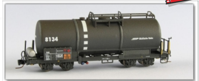
Nm-018.1: RhB Kesselwagen Uah 8131 - 8140 Farbgebung dunkelgrau (leichte Alterung)

dunkelgraue Lackierung mit leichter Alterung