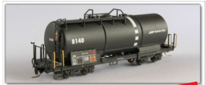
Nm-018.0: RhB Kesselwagen Uah 8131 - 8140 Farbgebung anthrazit (fabrikneu)

Lackierung anthrazit gemäß Zustand nach Aufbau des neuen Kessels