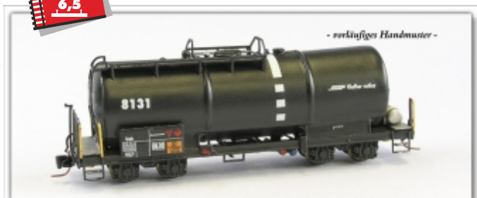
Nm-018.1: RhB Kesselwagen Uah 8131ff. Farbgebung anthrazit (fabrikneu)

Die Mineralöltransporte stellen einen wichtigen Bestandteil des Güterverkehrs dar. Mit rund 50 Kesselwagen weist die Flotte der RhB einen großen Bestand dieser Fahrzeuge aus. Die weiße Bauchbinde weist auf die vorhandene Gasrückführung hin, die einen wichtigen Baustein der Sicherheitseinrichtung darstellt.