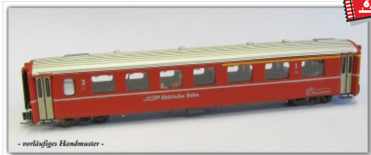
Nm-108.3: RhB Einheitswagen II, Stammnetz, AB1561-1570 (1./2.Kl.), Beschriftung der 1990er Jahre