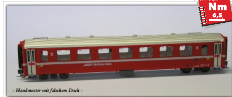
Nm-108.7: RhB Einheitswagen II, Stammnetz, B2374-2450 (2.Kl.), Beschriftung der 2010er Jahre

Nach rund 30 Jahren Einsatzzeit durchlief die Serie der Einheitswagen II eine vollständige Überarbeitung der Inneneinrichtung, um an die gestiegenen Komfortansprüche der Reisenden angepasst zu werden. Diese sogenannte Refit-Aktion ist äußerlich an den neuen Dachlüftern über den Türeinstiegen zu erkennen, sowie einem neuen Beschriftungs-schema, mit breitem Zierstreifen.