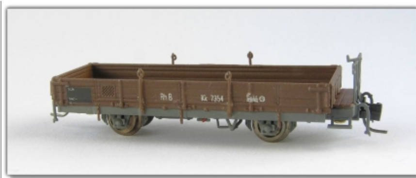
Nm-015.1: RhB Niederbordwagen mit kurzem Achsstand und mit Holzborden, Kk 7301 ff.