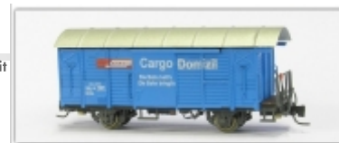
Nm-014.3: RhB gedeckter Güterwagen, blau, Cargo Domicil, Gbk-v 5501 ff. Gbk-v 5526