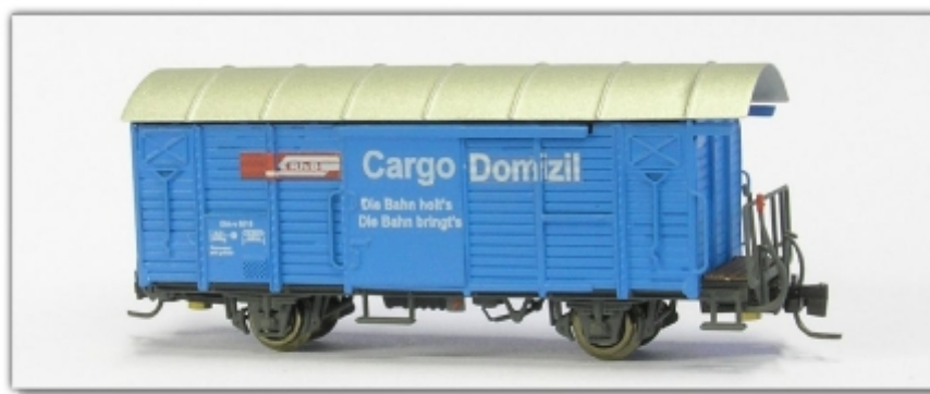
Nm-014.3: RhB gedeckter Güterwagen, blau, Cargo Domicil, Gbk-v 5501 ff.